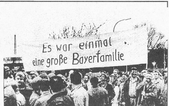
Etwa 1500 Bayer-KollegInnen demonstrierten am 14.4.97 vor dem Werk Uerdingen.