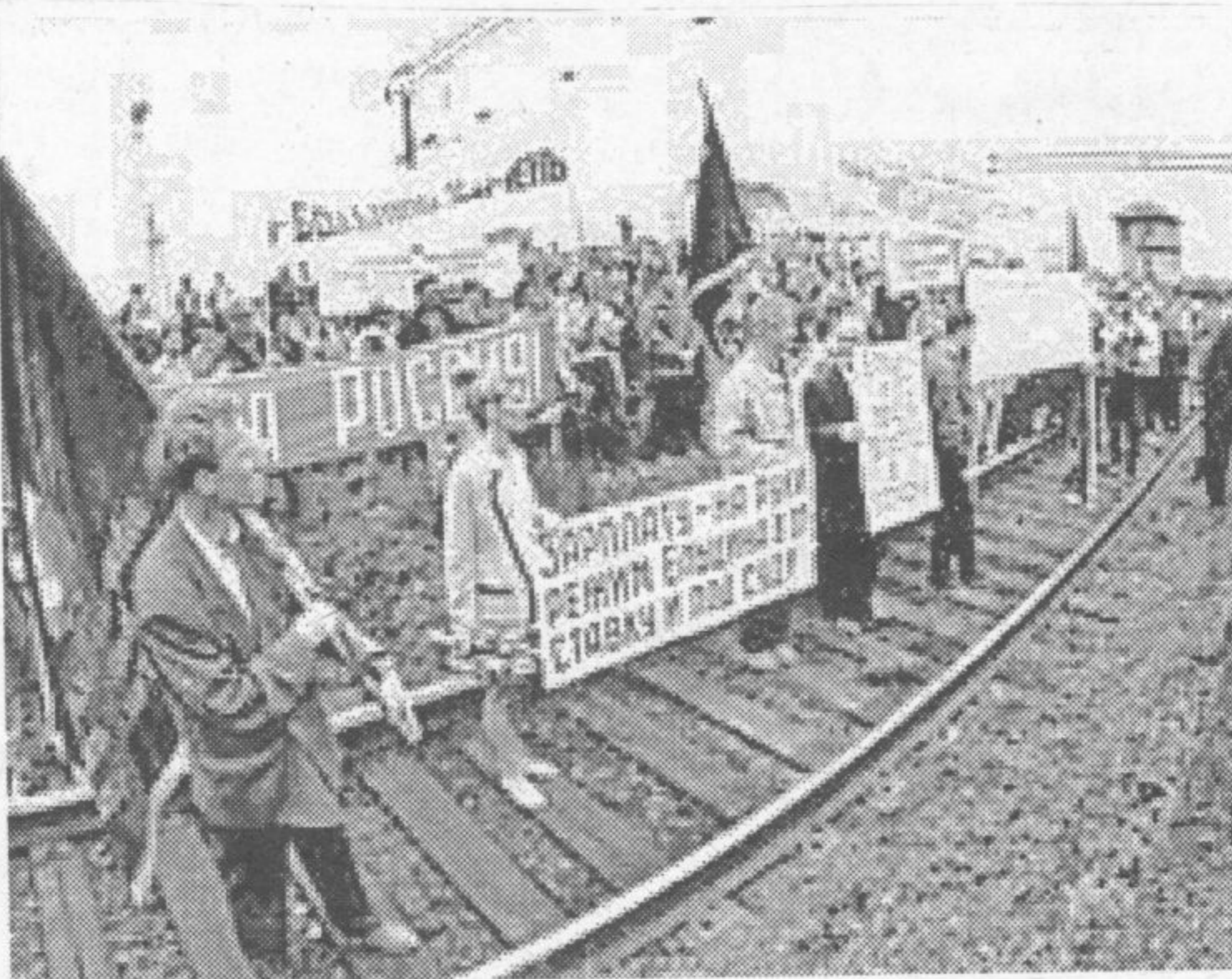
Wir können nicht mehr in die Augen unserer hungrigen Kinder sehen (Text des Plakates der Streikenden in Wladiwostok)

Wir halfen, den Bürokraten die Bergwerke und Fabriken wegzunehmen, die sie wie ihr Eigentum behandelten. Wir wollten in Freiheit unsere Arbeit tun, ohne ständig gebeugt zu gehen - und jetzt ist fast alles in den Besitz durchtriebener Geschäftsleute übergegangen, die einen Dreck auf die arbeitenden Menschen geben.